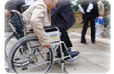
昨年(2009/11/12)のワークショップの様子